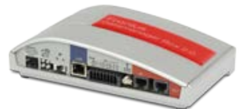
/ Fronius Datamanager Box 2.0